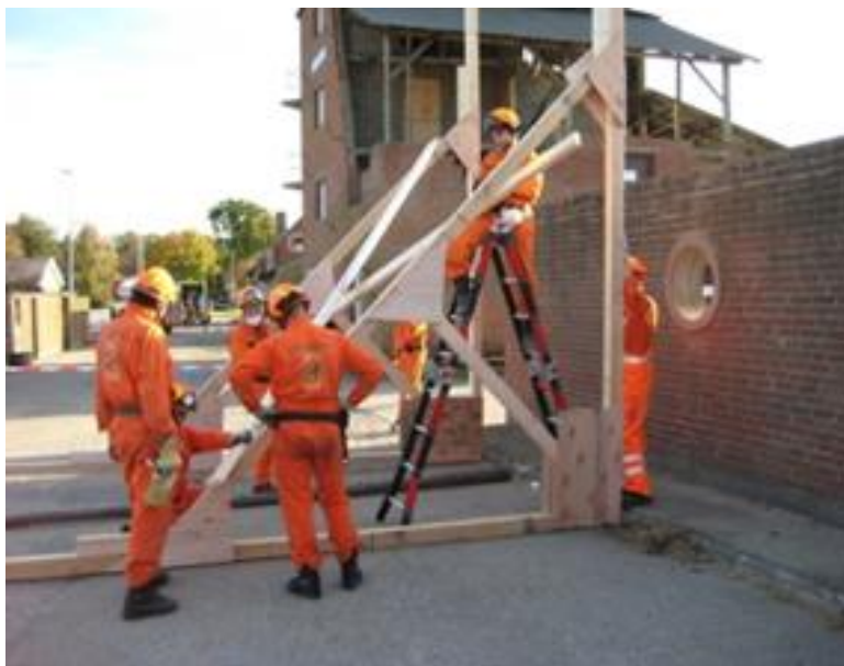
Figura 3: Equipo sometido al ejercicio IEC de 36 horas.