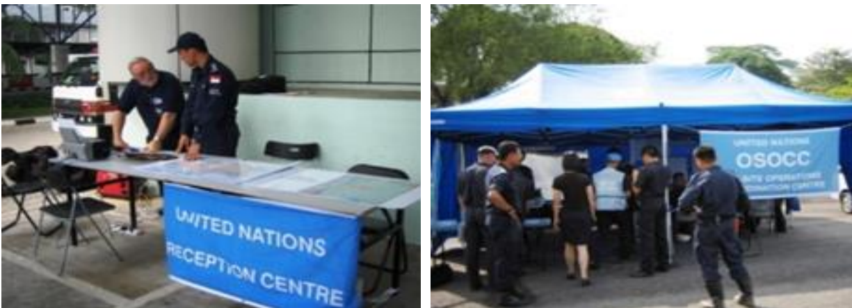
Figura 5: RDC y OSOCC establecidos durante un ejercicio de IER.