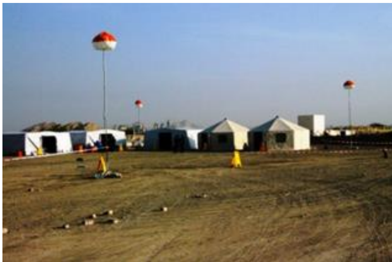
Figura 6: Base de operaciones de un equipo.