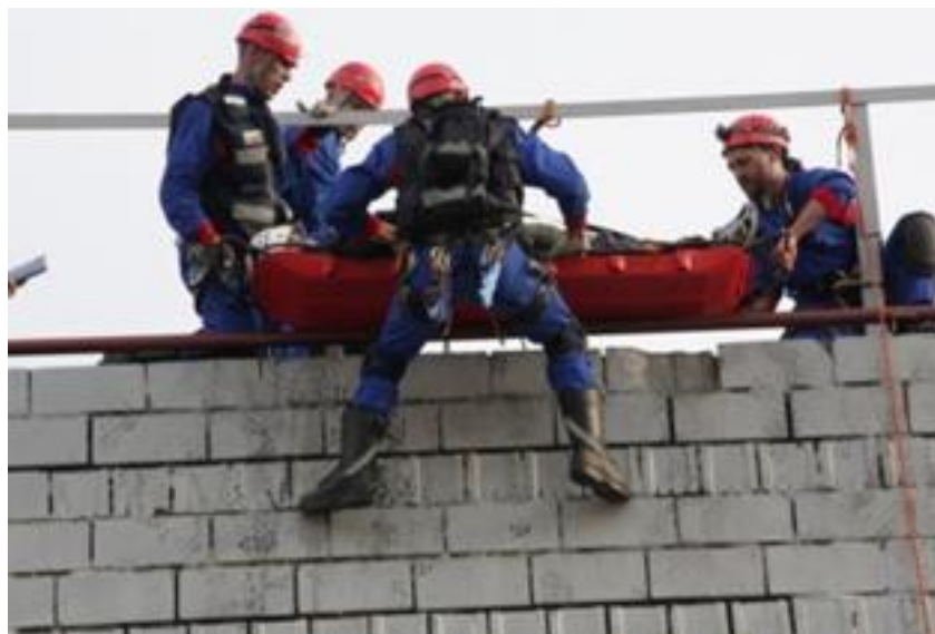
Figura 4: Equipo practicando una operación de rescate en altura.

El ejercicio debe diseñarse utilizando escenarios de colapso estructural realistas en constante evolución y no debe ser un ejercicio que demuestre habilidades técnicas individuales (escenificar el ejercicio usando estaciones prefijadas de rendimiento de habilidades). El ejercicio de desastre simulado es necesario para abarcar todas las etapas clave de la respuesta internacional a desastres.