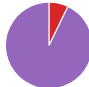
Gráfico 3. Opinión del apoyo dado en el anterior proceso de evaluación por parte del equipo de Desarrollo organizacional