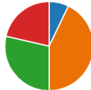
Gráfico 2. Temas de refuerzo en los acompañamientos